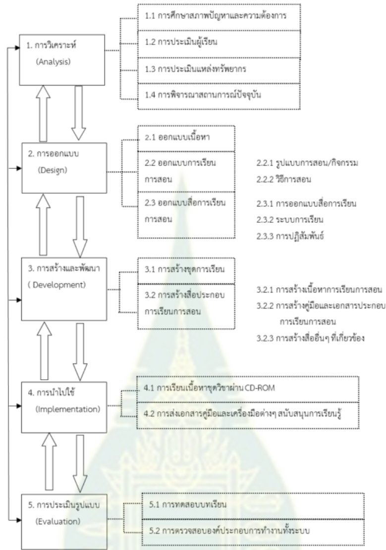
ภาพที่ 1 กระบวนการดำเนินการออกแบบการเรียนการสอน

7) ผลการวิเคราะห์ผลิตผลของโมเดลชุดการเรียนทางไกลอิเล็กทรอนิกส์แบบมัลติมีเดีย ปฏิสัมพันธ์สำหรับฝึกปฏิบัติการนวดไทยเพื่อสุขภาพ ประกอบด้วยผลสัมฤทธิ์ทางการเรียน และความพึงพอใจต่อชุดการเรียนทางไกลอิเล็กทรอนิกส์แบบมัลติมีเดียปฏิสัมพันธ์เรื่อง ฝึกปฏิบัติการนวดไทย